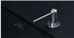
Percement distribution savon