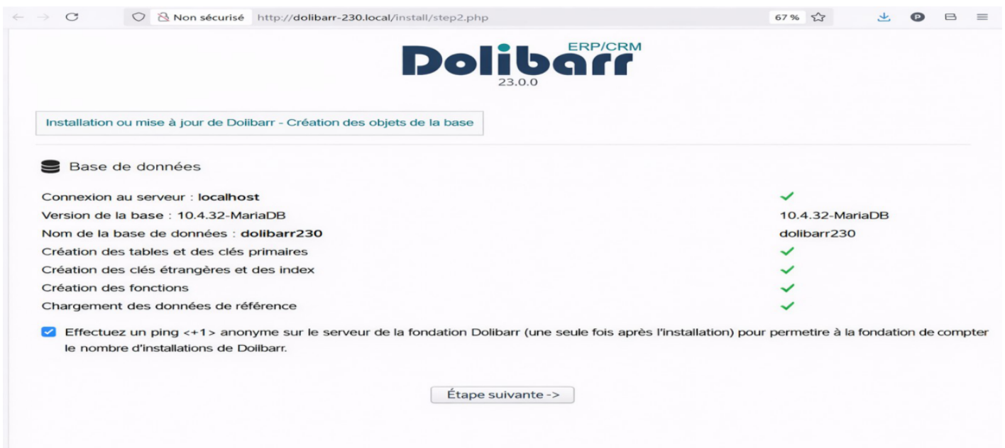
Figure 3.20 – Progression de l'installation des tables