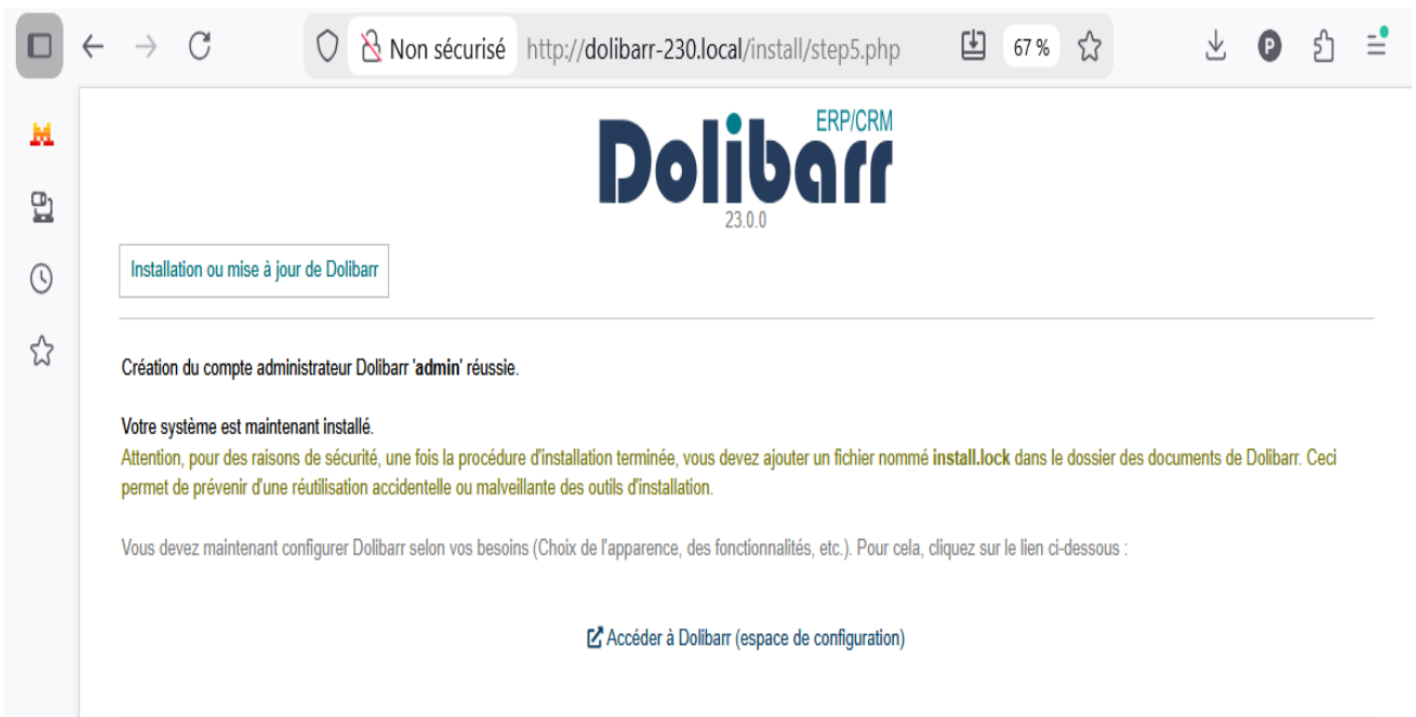
Figure 3.23 – Installation terminée — accès à Keatic ERP

Astuce : Notez bien vos identifiants administrateur. En cas de perte, il est possible de les réinitialiser directement en base de données, mais cela nécessite un accès à phpMyAdmin ou à la ligne de commande MySQL.