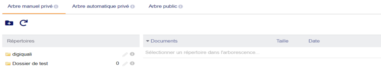
Figure 14.23 - Répertoires manuels — vue 2