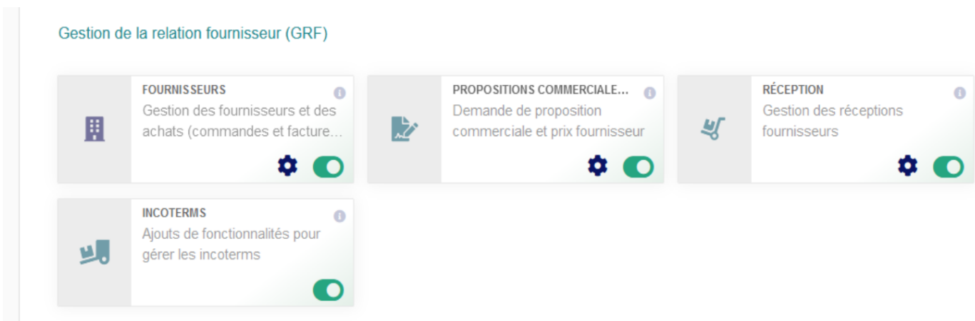
Figure 8.4 - Configuration du module Contrats

Vous trouverez le module Contrats dans la famille Gestion de la relation client (GRC).