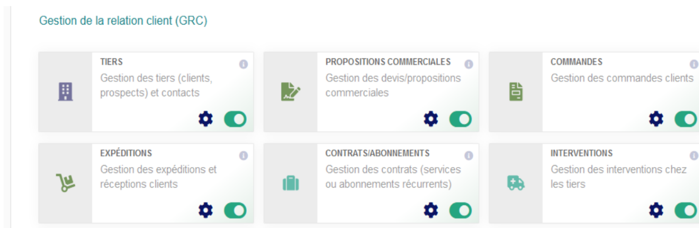
Figure 8.1 - Configuration du module Propositions commerciales

Vous trouverez le module Propositions commerciales dans la famille Gestion de la relation client (GRC). Le pictogramme d'état doit être vert pour signifier son activation ; le pictogramme suivant, en fin de ligne, permet d'accéder à la page de paramétrage spécifique.