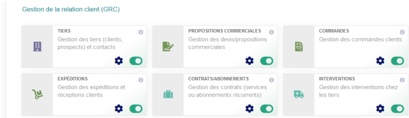
Figure 8.2 – Configuration du module Commandes clients

Vous trouverez le module Commandes clients dans la famille Gestion de la relation client (GRC).