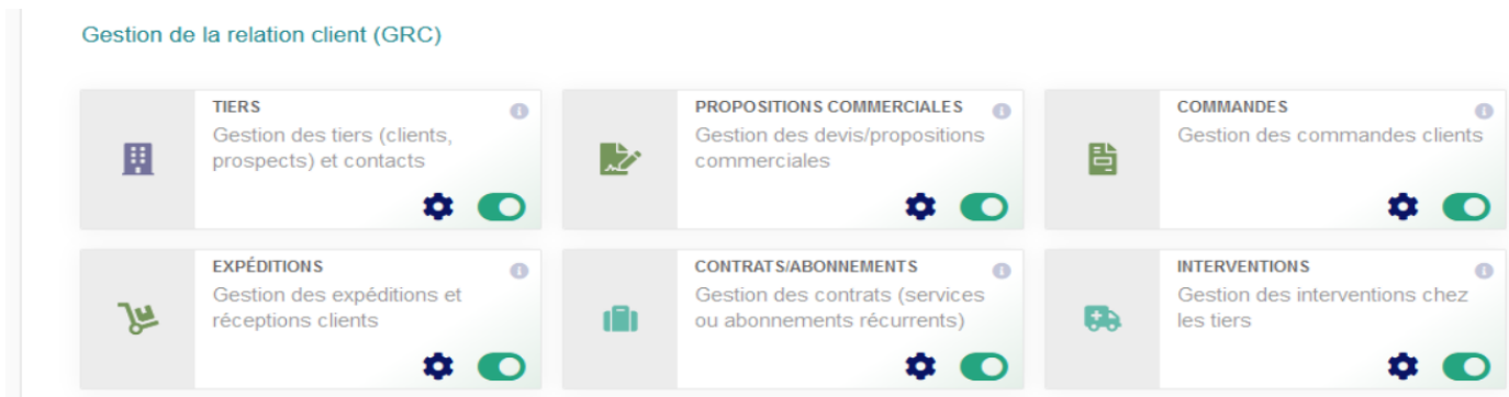
Figure 8.5 – Configuration du module Interventions

Vous trouverez le module Interventions dans la famille Gestion de la relation client (GRC).