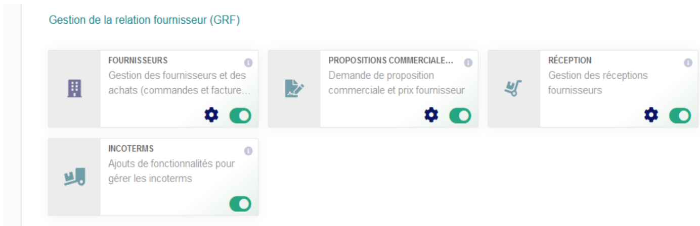
Figure 8.9 – Options du module Demandes de tarifs

Modèles de documents Le modèle Aurore est disponible par défaut. Si le module UltimatePDF est installé, activez ultimate_supplieurproposal. Autres options