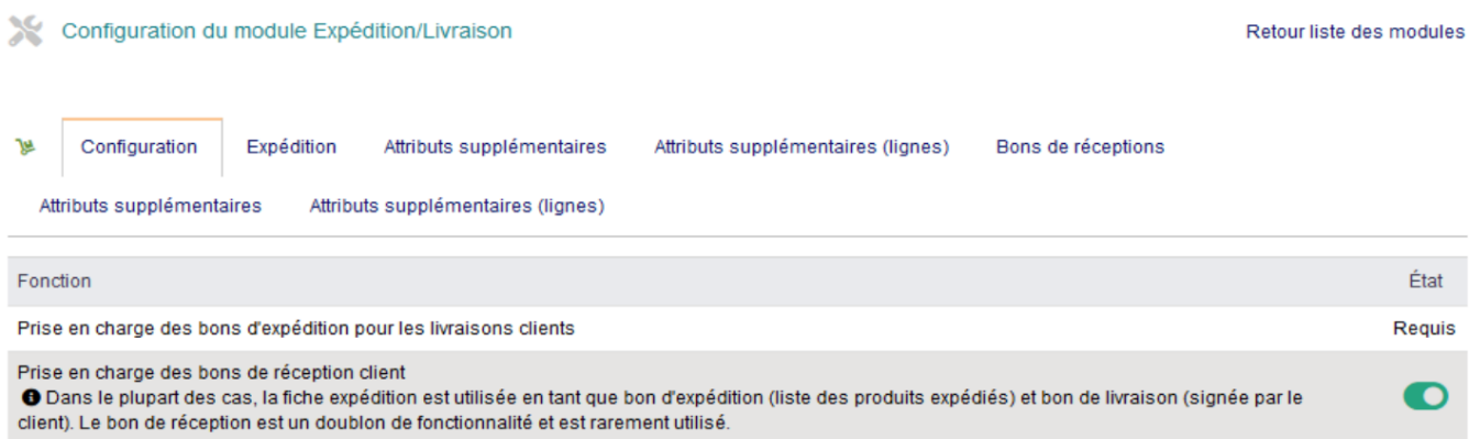
Figure 7.37 – Sélection du modèle de bordereau d'expédition

Modèles : Ribera (masque personnalisable) ou Safor (SHyymm-nnnn). Modèles de bordereau d'expédition : Merou, Rouget (standard) et ultimate_shipment (UltimatePdf).