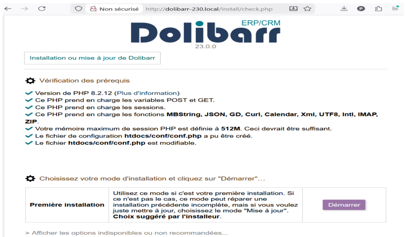
Figure 3.17 - Étape 1 de l'assistant web : vérification de l'environnement

L'assistant vérifie automatiquement la compatibilité de votre environnement (version PHP, extensions re- quisies, droits sur les dossiers...).