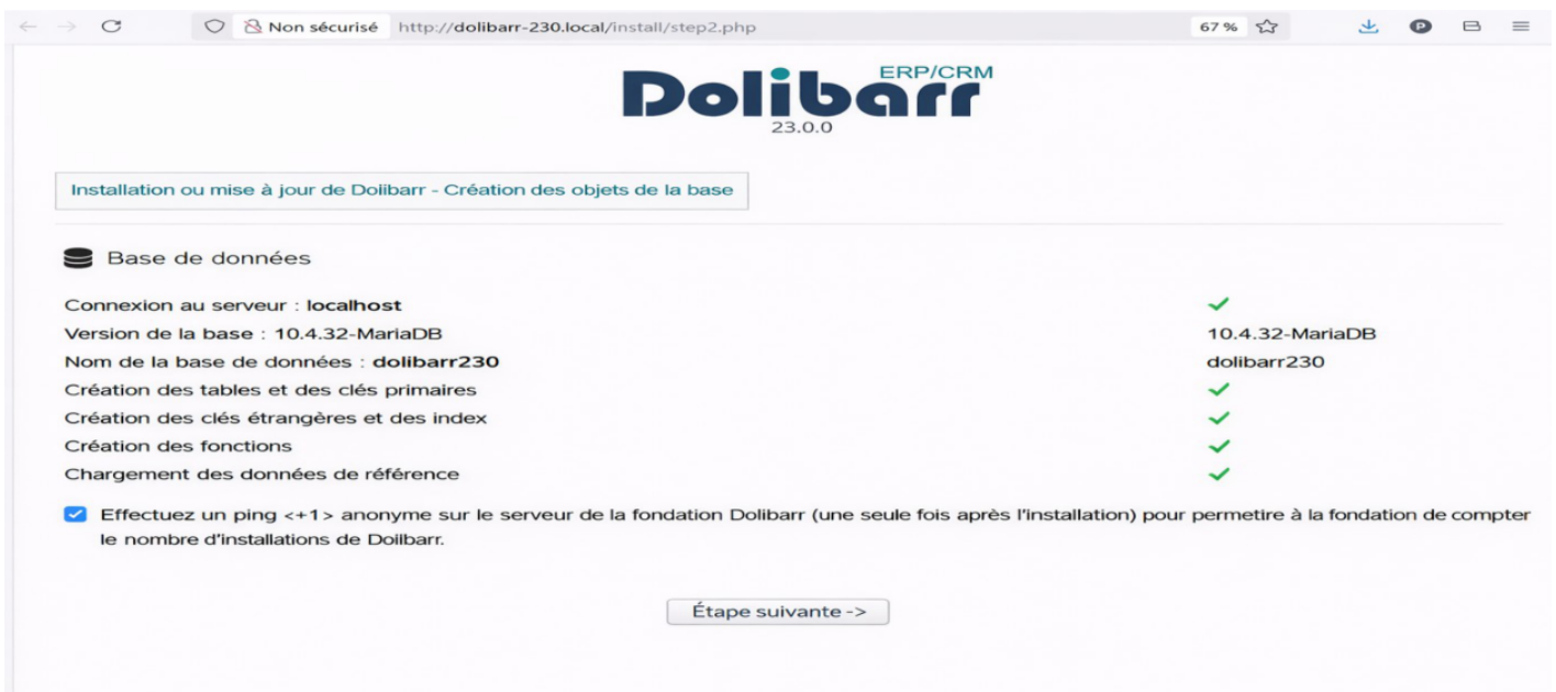
Figure 3.20 – Progression de l'installation des tables