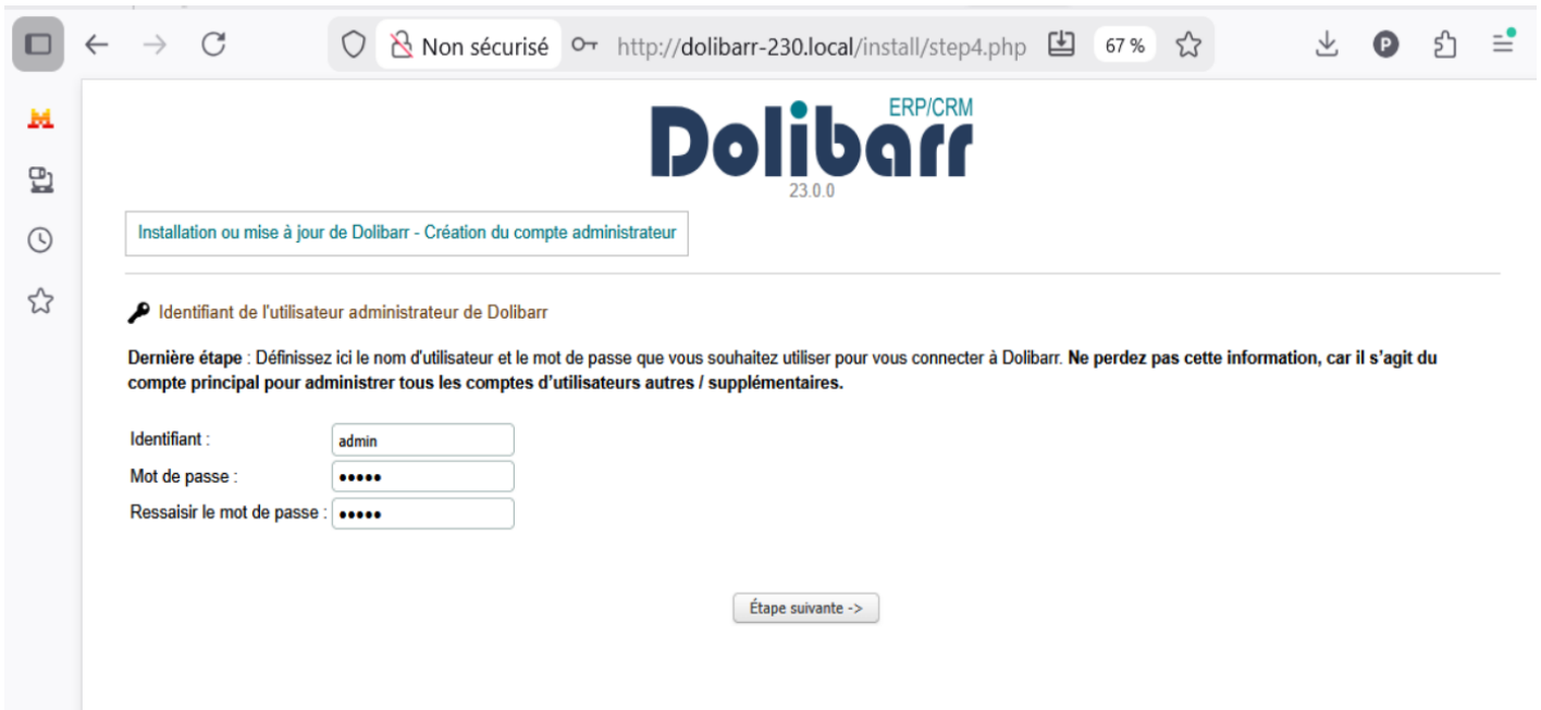
Figure 3.22 – Création du compte administrateur