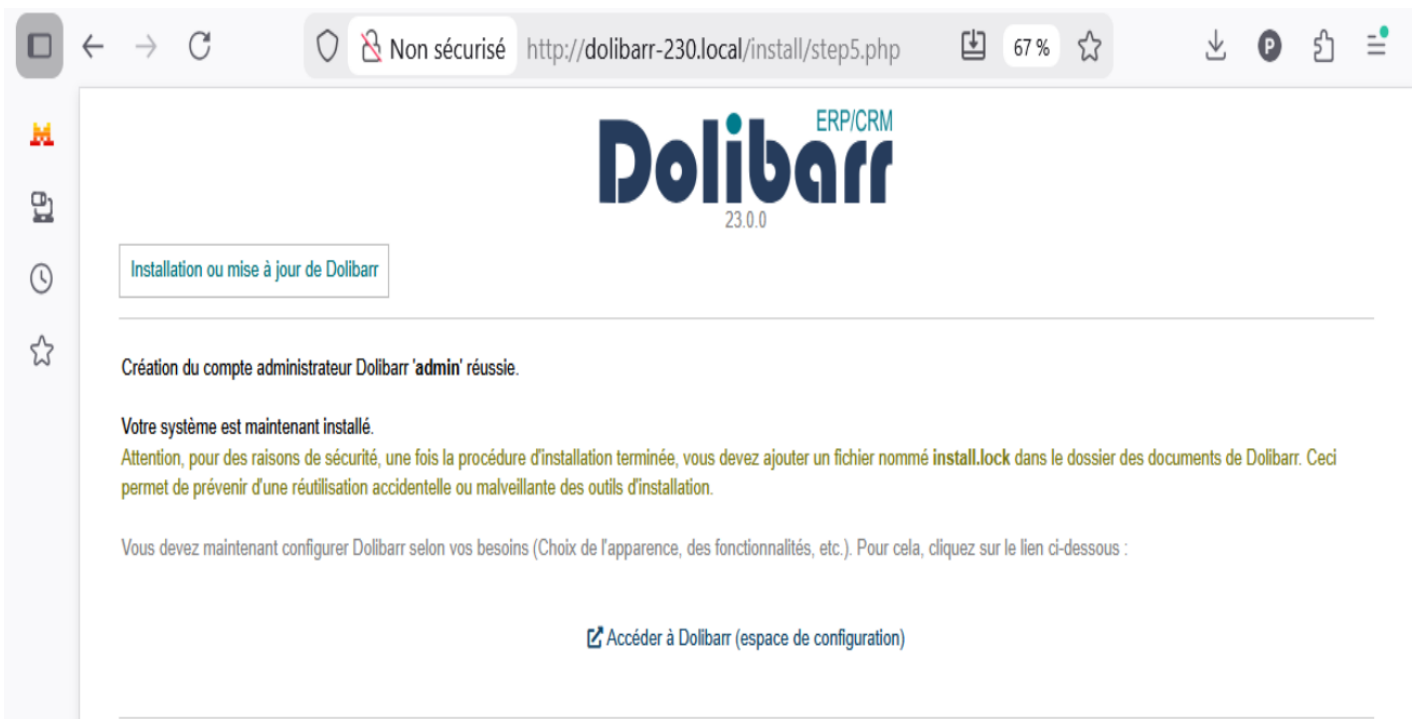
Figure 3.23 – Installation terminée — accès à Dolibarr

Astuce : Notez bien vos identifiants administrateur. En cas de perte, il est possible de les réinitialiser directement en base de données, mais cela nécessite un accès à phpMyAdmin ou à la ligne de commande MySQL.